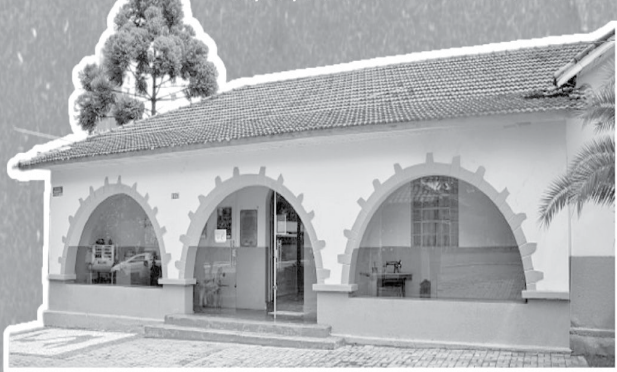
Museu Municipal Deolindo Mendes Pereira

DOMINGO NO MUSEU Horário especial Todos domingos de março 05, 12, 19 e 26 | 08h às 12h