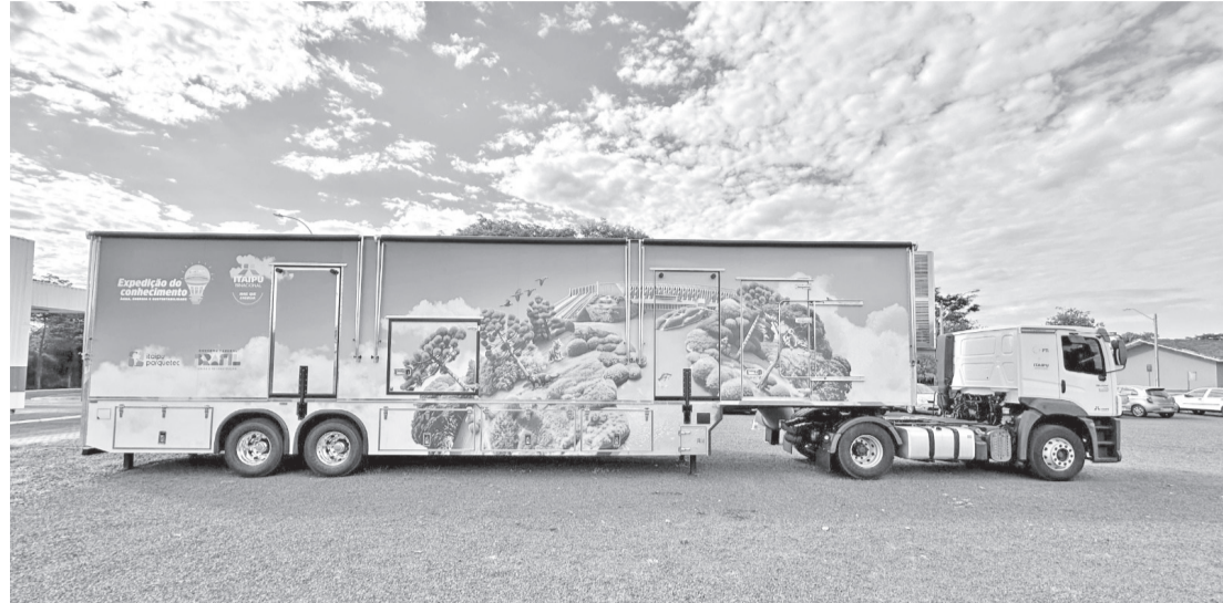
Participantes do XVI CONCEPAR INTERNACIONAL poderão conhecer atrações educativas que unem ciência, educação e sustentabilidade

O sistema consiste em uma esfera de 1,7 metro de diâmetro, fabricada em fibra de carbono. Por meio de projetores de alta performance sincronizados digitalmente, imagens animadas da Terra são projetadas na superfície sem divisórias, criando uma visão contínua e imersiva. Com acesso a mais de